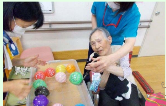
ヨーヨーうまく釣れたかな？