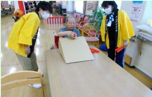
お祭りでゲームを楽しみました😊