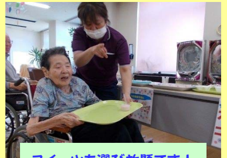
スイーツも選び放題です！