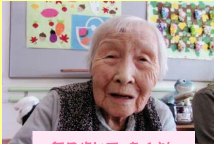
毎日歩いて、たくさんご飯食べています！