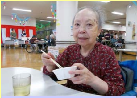
お腹いっぱいご馳走様でした

8月にオニオンコートの夏祭りが行われました。施設の中での開催となりましたが、盆踊りや美味しい縁日を楽しまれていたご様子でした。 今号では、夏祭りの様子や元気に過ごされている日々のご様子を写真で紹介いたします！