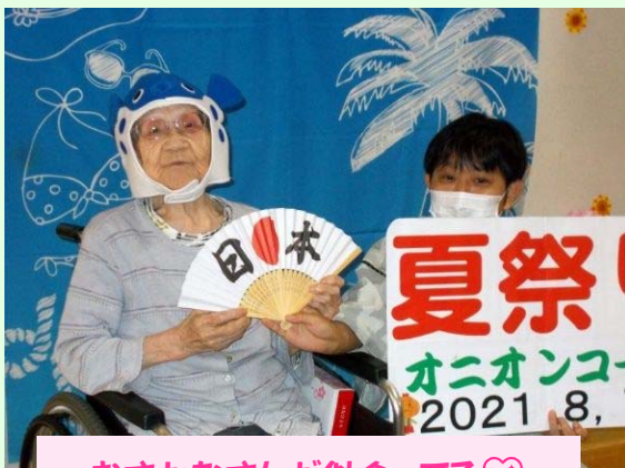
おさかなさんが似合ってる♡