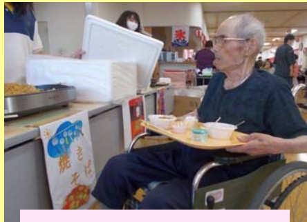
焼きそばが美味しそう！