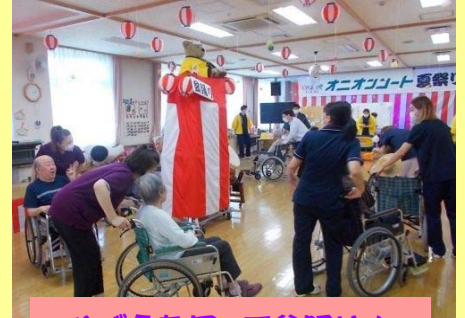
やぐらを囲って盆踊り♪