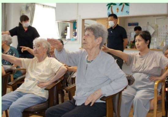
体操の先生の真似して頑張ったよ！