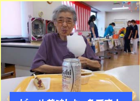
ビール美味しかったです！