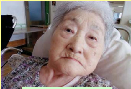
甘いジュースや炭酸が好きです！