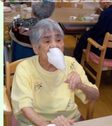
わたあめ美味しかったよ！