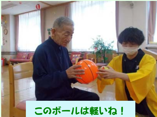
このボールは軽いね！