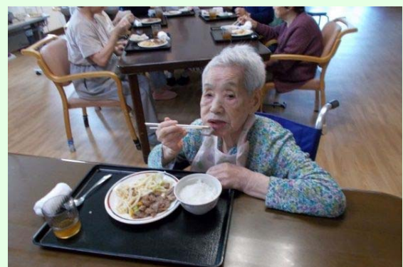
みんなで焼肉したよ！美味し〜い