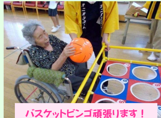
バスケットビンゴ頑張ります！