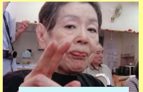
敬老会のお祝いです！