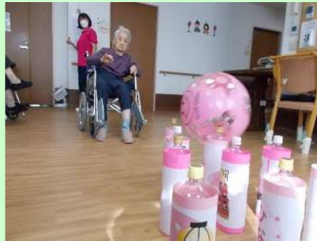
ボーリングでいざ、勝負！！