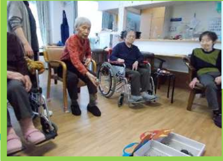
赤鬼に狙いを 定めて... そーれっ！！