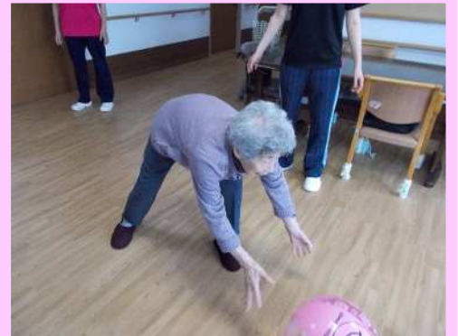
低い位置から狙って狙って！