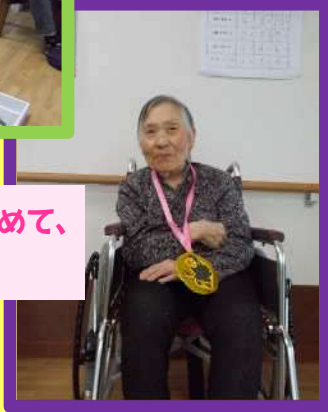
バッチリ優勝決めて、 満足です♪