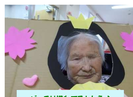
バッチリ撮れてるかしら♪