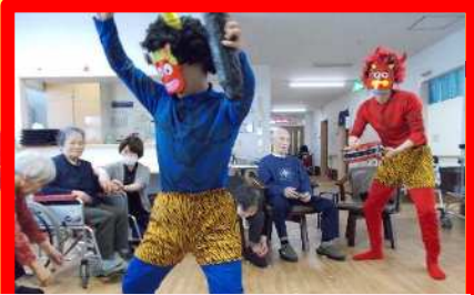
赤鬼、青鬼がやってきたぞ〜！！