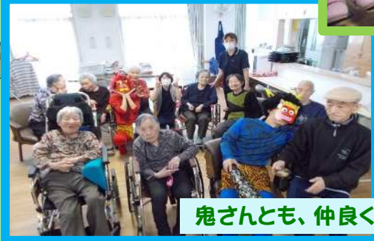
鬼さんとも、仲良くなった！？