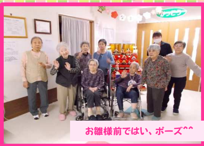
お雛様前ではい、ポーズ^^