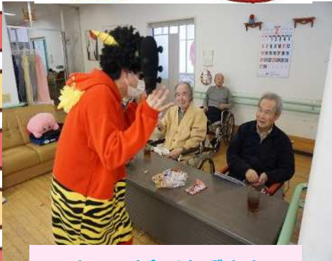
オニには負けんぞ!!