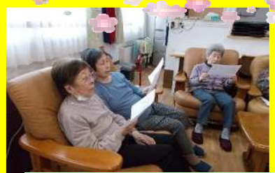
うれしいひなまつりを合唱♪